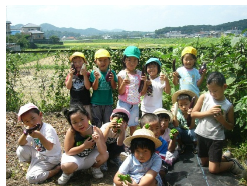
畑で旬の食材を収穫