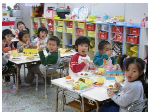
幼保統一メニューでの給食の様子