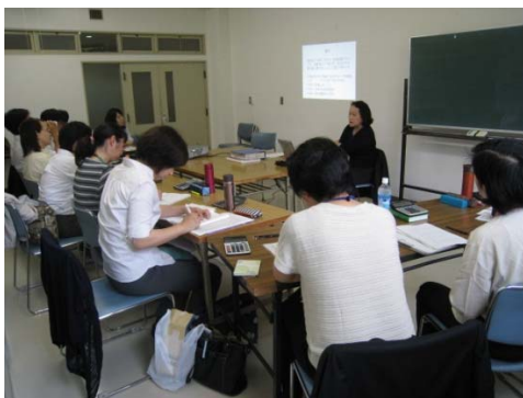
指導者育成のための研修風景