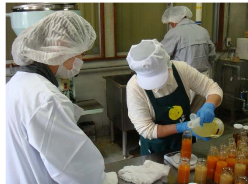
商品開発支援の様子