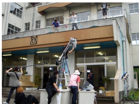
デジタルハリウッド大学の映画撮影 実習風景