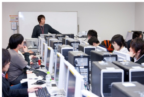
デジタルハリウッド大学の授業風景