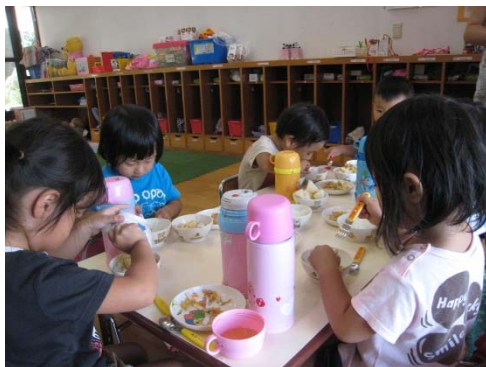
給食風景（蒲刈保育所）