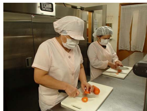
調理室（下蒲刈保育所）