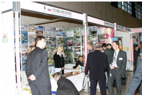
外国企業が新潟国際ビジネスメッセに出展