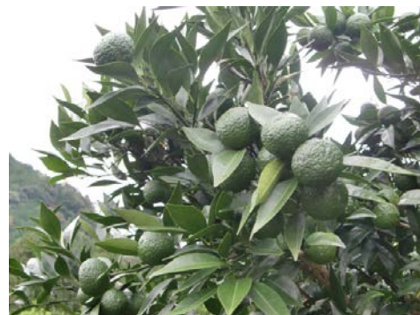
熊野市で生まれた香酸柑橘『新姫』