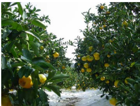
熊野市の特産品である柑橘類