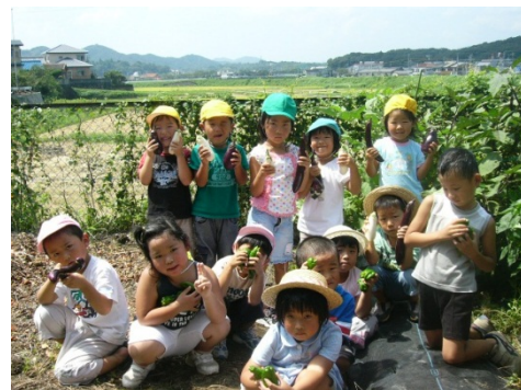
食育の一環で旬の食材を収穫