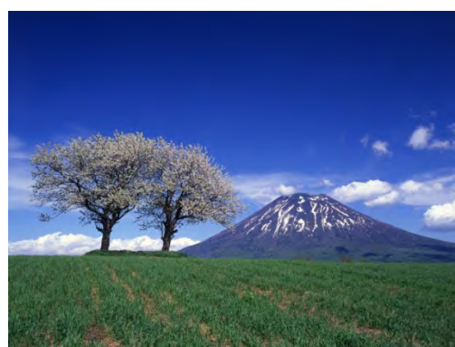
ふるさと眺望点から羊蹄山を眺める