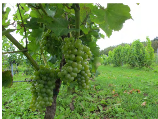
収穫を待つワイン用ブドウ