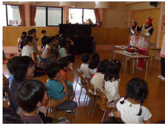
食育の様子（ジャム作り）