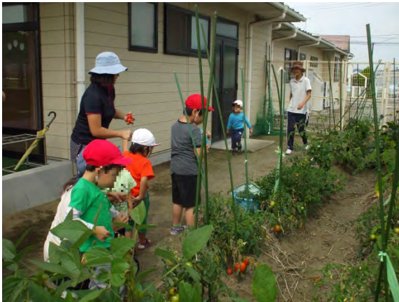
食育の様子（家庭菜園）