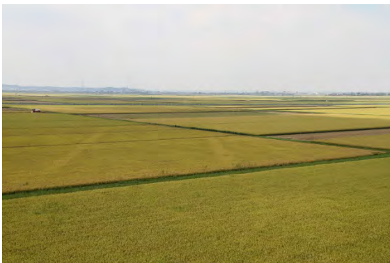
水郷早場米の産地