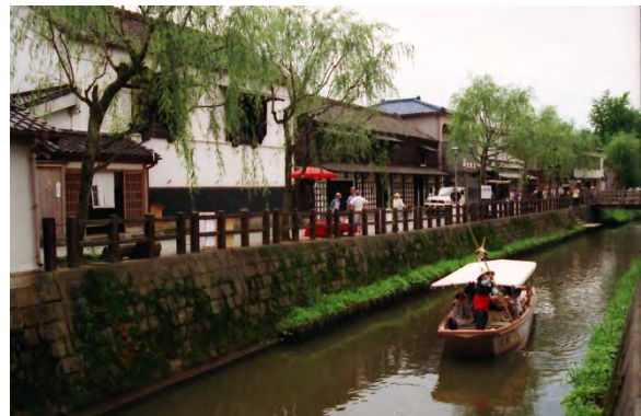
小野川沿いの歴史的町並み