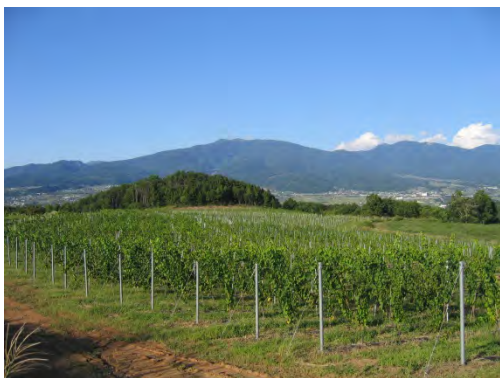
ワイン用ぶどう畑