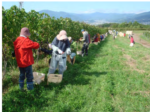
ワイン用加工ぶどうの収穫