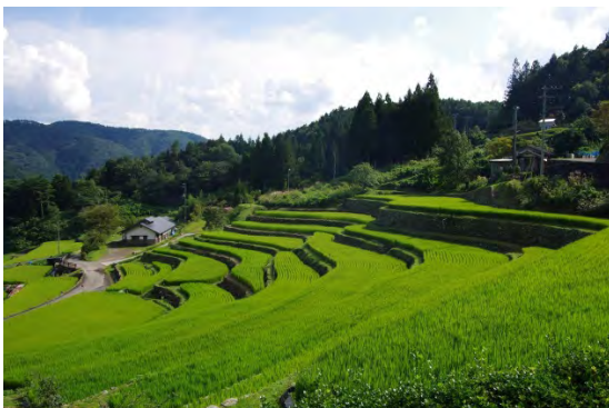
「神在居千枚田」棚田オーナー制度を日本初の試みとして導入した