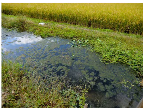
生物多様性に配慮したツシマ ヤマネコ米の田んぼ