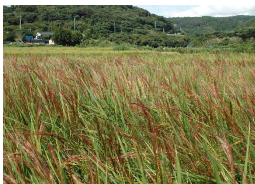
穂が実った赤米神田