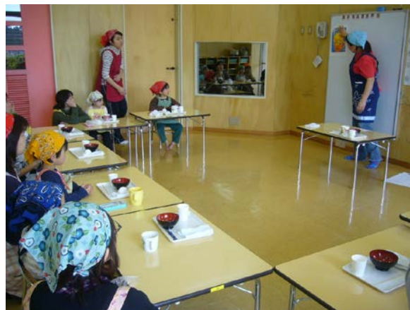
お菓子づくりの説明－食育