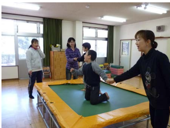
障害児への療育の様子