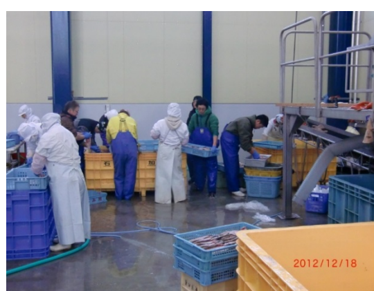
宮城県 実習実施機関での実習の様子