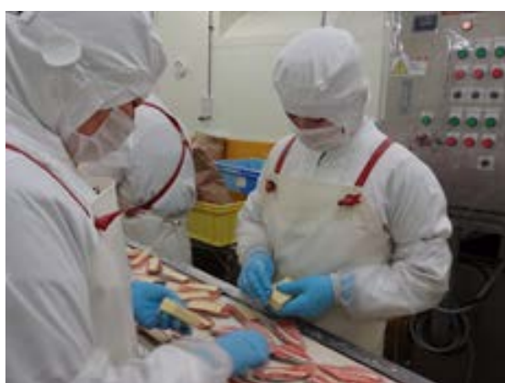
岩手県 実習実施機関での実習の様子