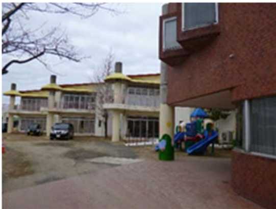
子ども総合支援センター－with の外観