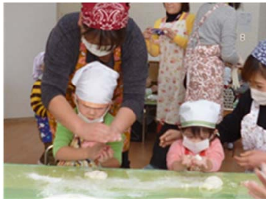
施設における食育の一場面 (おもちつき)