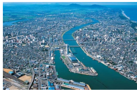
環日本海における経済拠点都市新潟