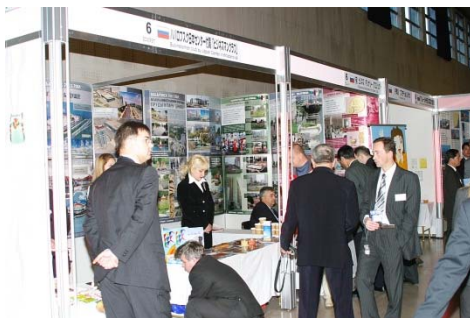
新潟市内で開催される 国際商談会の風景