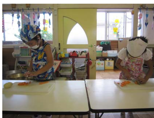
食育（カレー調理体験）