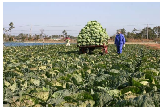
露地栽培キャベツの収穫