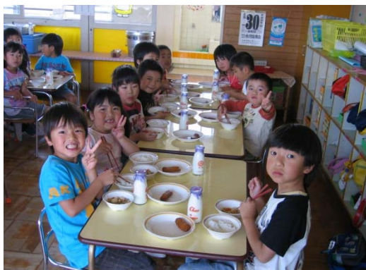
公立保育所給食の様子