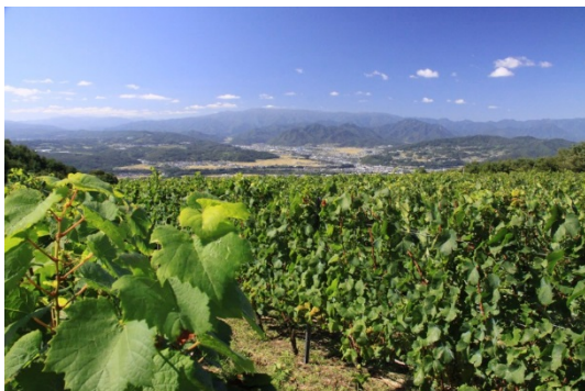
ワイン用ぶどう畑から望む景観