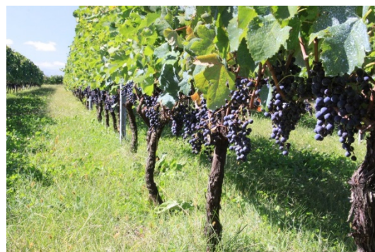
収穫を待つワイン用ぶどう