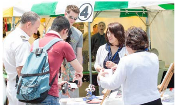
クルーズ船乗船客への案内の様子