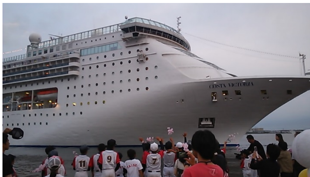
クルーズ船寄港時の歓迎の様子