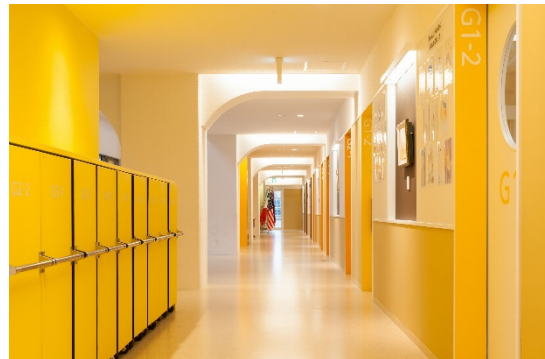
LCA国際小学校 校舎内