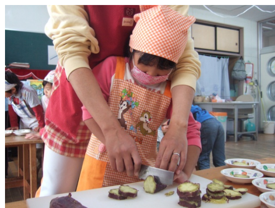
収穫体験したさつまいもを調理