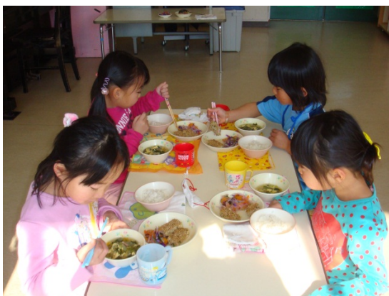
地元食材を使用した給食を食べる園児