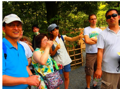
大学生のボランティアガイド による案内風景