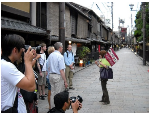
京都の花街「祇園」での ウォーキングツアー案内風景