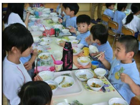
小学生との合同給食会