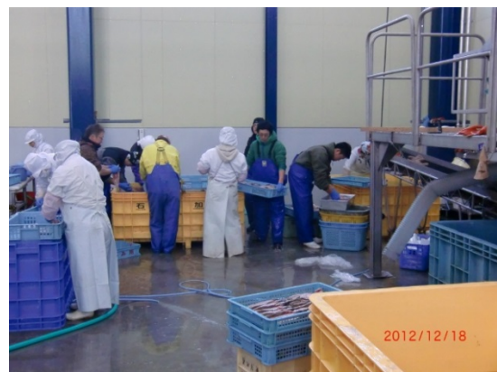
宮城県 実習実施機関での実習の様子