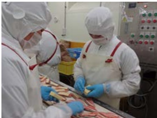
岩手県 実習実施機関での実習の様子