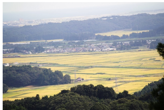
柴田町の田園風景