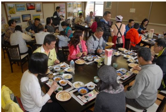
台湾からの観光客 「たけのこ御膳でおもてなし」