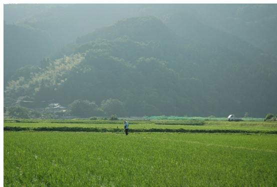
小川町の有機農業の農村風景