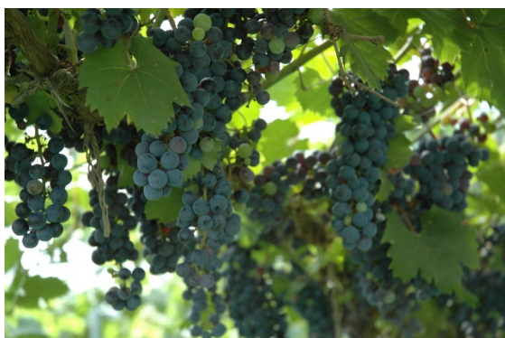
有機農業によるブドウ