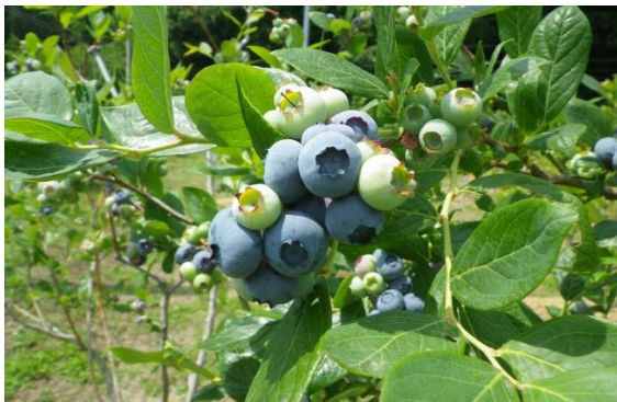
無農薬栽培されているブルーベリー