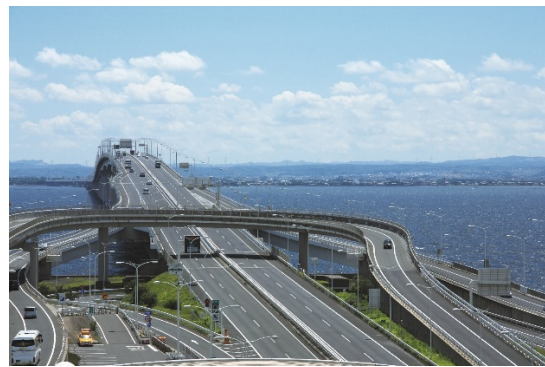
木更津市の玄関口となる 東京湾アクアライン