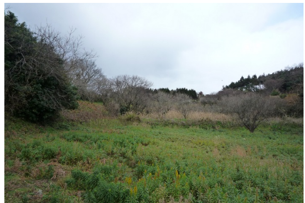
ブドウ畑としての利用を目指す遊休農地