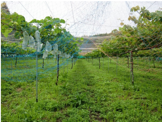
町内で栽培されるブドウ畑