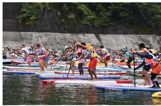
カヌーマラソン IN 丹沢湖