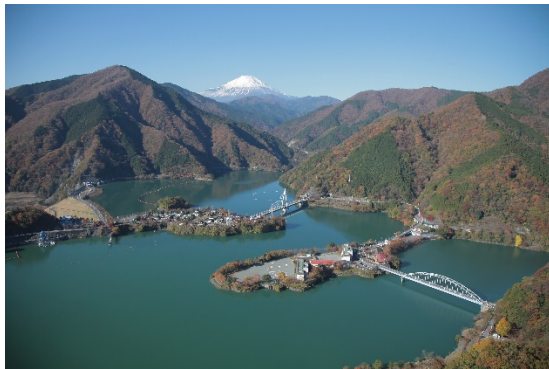
富士山を望む丹沢湖畔の 通信制高等学校