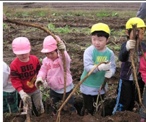
ごぼう収穫の風景