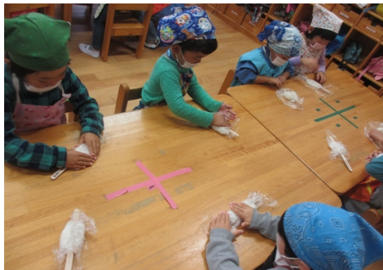
郷土食(五平餅)のクッキング