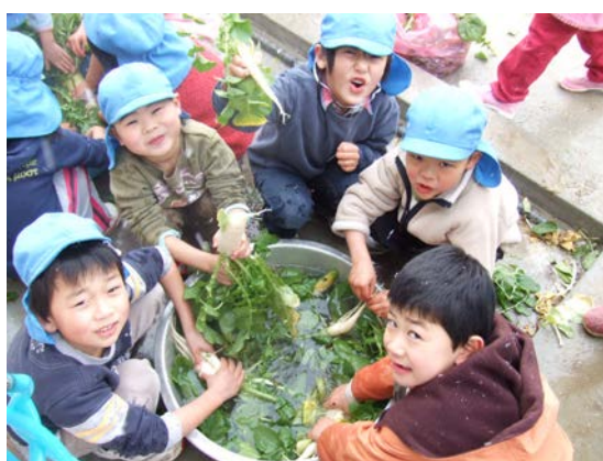
保育所等で栽培した 農作物の収穫風景