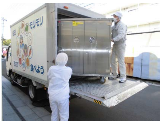
保育所への給食搬入状況