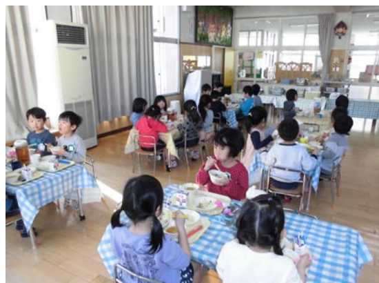
配膳後、食事の様子