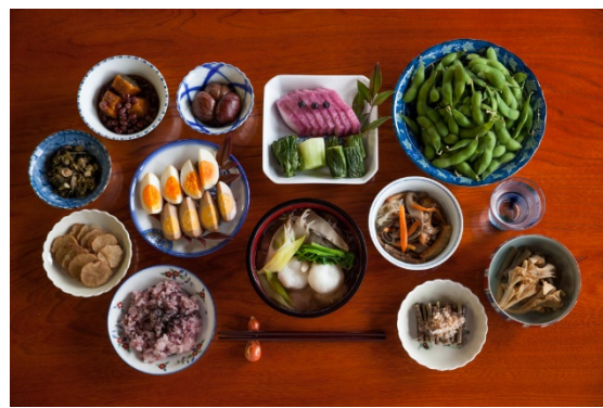
秋田市産農産物で作った家庭料理