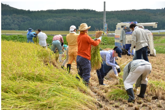
都市農村交流事業で実施した 稲刈り体験