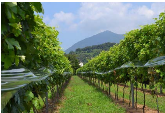
ワイン用ぶどう畑