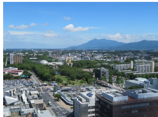
つくば市の 都市と田舎が融合した街並み