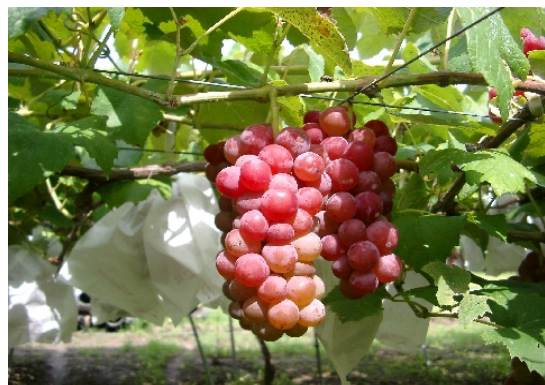
内外に高い評価を受ける「ぶどう」