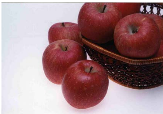
当地域の主力産品「りんご」