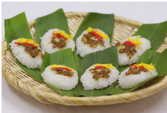
郷土料理の「笹ずし」