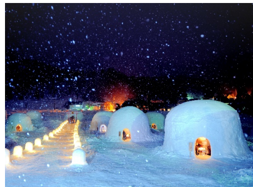
「かまぐらの里」風景