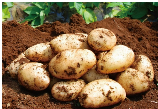
ブランド野菜の代表格「三島馬鈴薯」