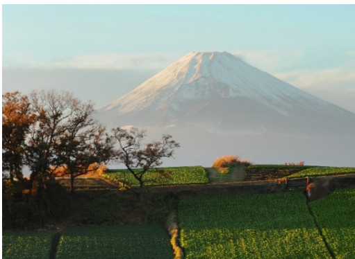
箱根西麓地域から望む富士山