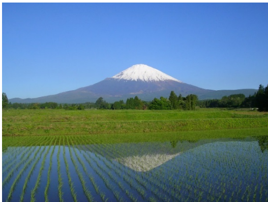
御殿場市の田園風景