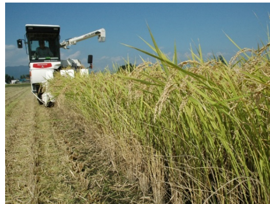
特産物コシヒカリ（稲刈り風景）