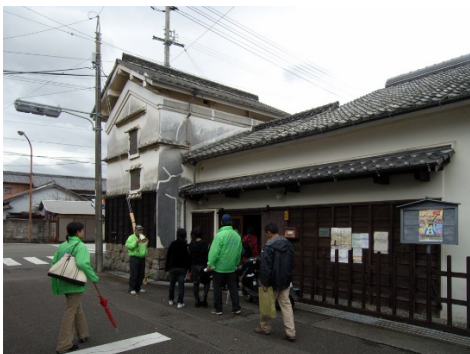
登録有形文化財を見学する観光客