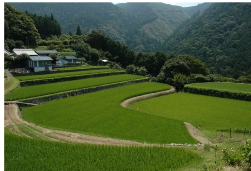
奈半利町の田園風景