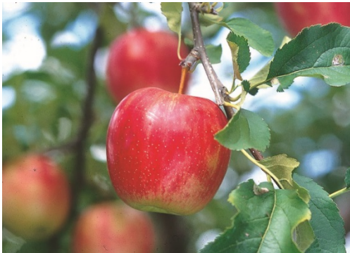
市内で栽培されるりんご