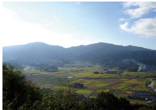
嘉麻市の田園風景