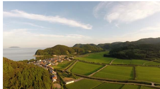
富江町田尾の田園風景