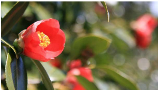
五島地域に多く自生するやぶ椿