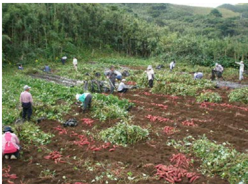
高齢者生きがいづくり事業による芋掘り風景