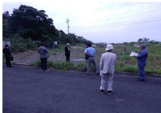
焼酎蔵建設予定地（大里地区）