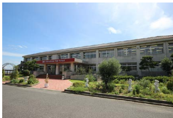
廃校となった旧洲本実業高校東浦校を利活用