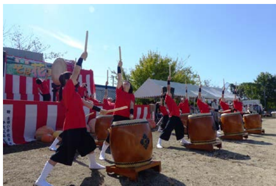
地域行事での和太鼓演奏