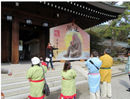
古代衣装体験をして橿原神宮参拝