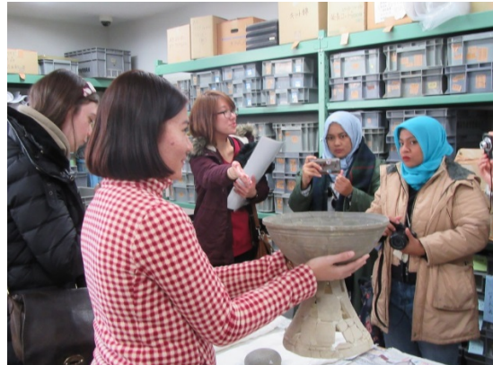
歴史に憩う橿原市博物館での見学の様子