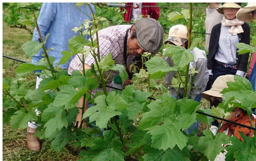
農業体験（ブドウの芽がき）