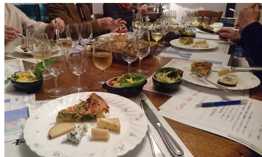
ワインを学び・楽しむ体験