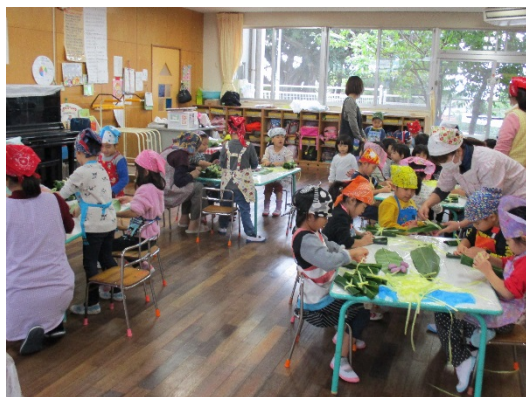
沖縄継承行事ムーチーづくり