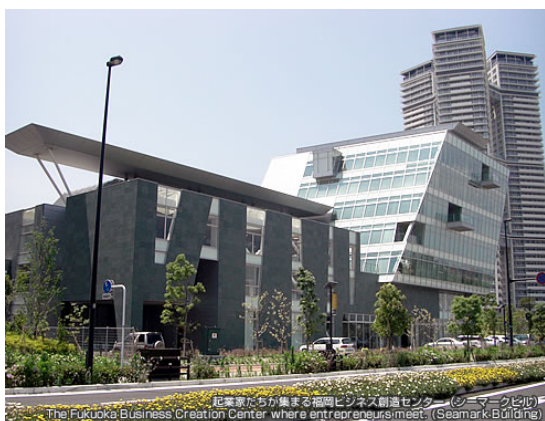
サイバー大学が入居する シーマークビル